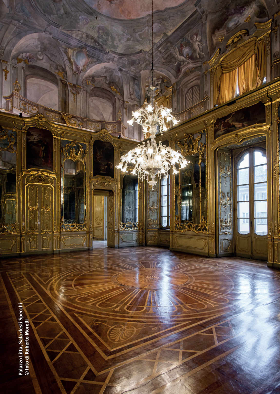
Palazzo Litta, Sala degli Specchi